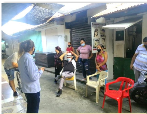
Palza de Mercado - Puerto Boyacá

Así mismo, el miércoles 16 de febrero, los trabajadores de la plaza de mercado del municipio de Puerto Boyacá, conocieron los trámites y procedimientos necesarios para la legalización del servicio de energía, así como los riesgos que traen consigo las conexiones irregulares.