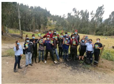
PAIPA → Empresa Carbonera Nueva Esperanza

Los días 14, 16 y 23 de febrero del presente año, los funcionarios de las Minas Tres Esquinas del municipio de Tuta, El Tablón, del municipio de Socotá y Carbonera Nueva Esperanza del municipio de Paipa, abrieron sus puertas al equipo social del PERPE, con el fin de recibir capacitación acerca de seguridad eléctrica, ahorro de energía, uso legal y eficiente del servicio.