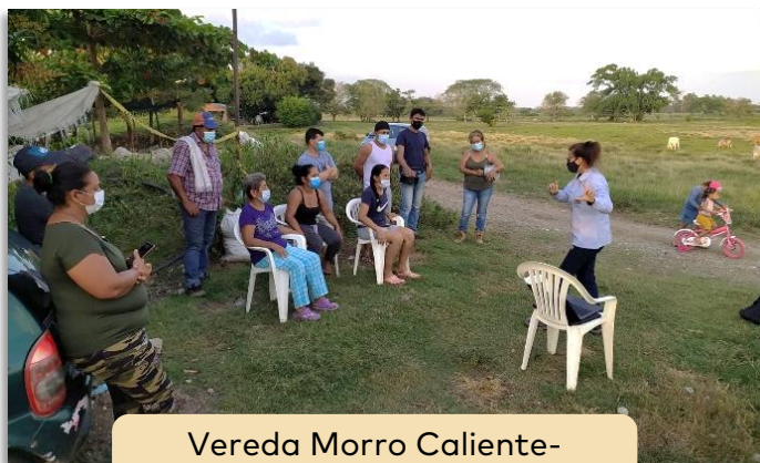
Vereda Morro Caliente- Puerto Boyacá

Haciendo énfasis en el uso legal del servicio, el pasado martes 15 de febrero el equipo de gestión social del Programa de Recuperación de Pérdidas de Energía dio a conocer a la comunidad de la Vereda Morro Caliente del municipio de Puerto Boyacá, las acciones que ejecuta la EBSA para el control y reducción de las pérdidas de energía eléctrica en todo el departamento.