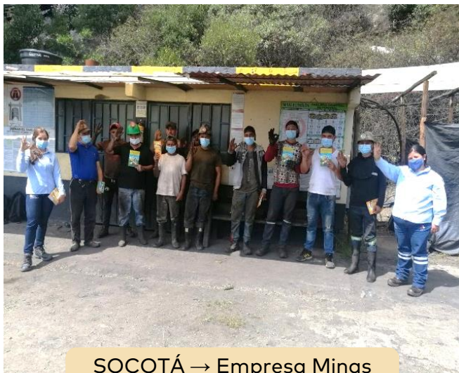
SOCOTÁ → Empresa Minas El Tablón S.A.S.

Los días 14, 16 y 23 de febrero del presente año, los funcionarios de las Minas Tres Esquinas del municipio de Tuta, El Tablón, del municipio de Socotá y Carbonera Nueva Esperanza del municipio de Paipa, abrieron sus puertas al equipo social del PERPE, con el fin de recibir capacitación acerca de seguridad eléctrica, ahorro de energía, uso legal y eficiente del servicio.