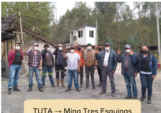
TUTA → Mina Tres Esquinas