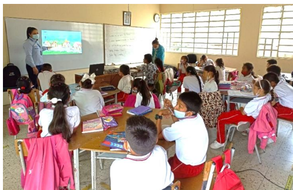
IE San Martín