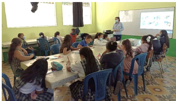
IE Santa Bárbara

La Empresa de Energía de Boyacá EBSA S.A E.S.P a través del equipo social del PERPE realizó encuentros de capacitación con los niños y niñas de las Instituciones Educativas Santa Bárbara y San Martín del municipio de San Pablo de Borbur, encuentros en los cuales se fomentó el cuidado del medio ambiente y se enseñó a los niños temas como generación de energía, uso legal del servicio de energía, uso racional de la energía y seguridad eléctrica; a través de estos encuentros, EBSA se compromete con la creación de una cultura de legalidad desde la niñez.