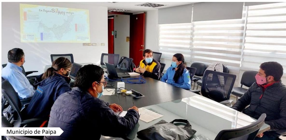
Municipio de Paipa

EBSA realizó la socialización del proyecto de Interconexión Eléctrica entre las Provincias Tundama, Centro, Ricaurte y el municipio de Vélez a 115 kV con las Alcaldías y Personerías municipales de los municipios de Paipa y Sotaquirá.