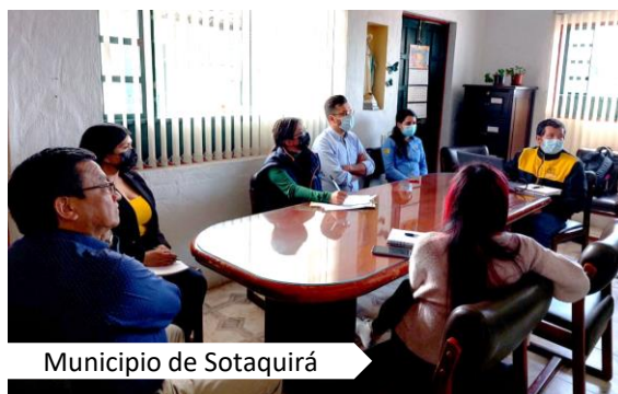
Municipio de Sotaquirá

Este importante proyecto se encuentra en su fase inicial de diseño y estudio de impacto ambiental, que permitirá mejorar y asegurar las condiciones de prestación del servicio de energía eléctrica en el corredor mencionado.