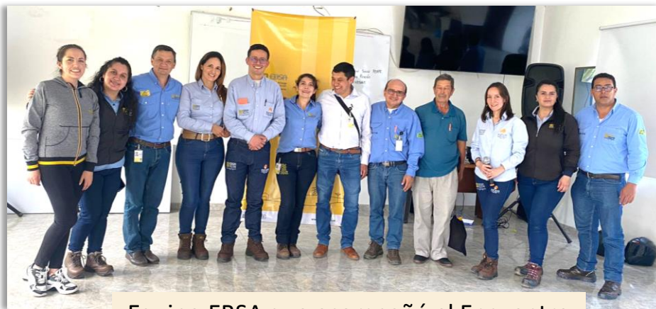
Equipo EBSA que acompañó el Encuentro

El Director de Zona Oriente se puso a disposición para seguir trabajando de la mano con los electricistas de la región por la seguridad y el bienestar de los usuarios.